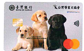
▲一卡通導盲犬認同卡